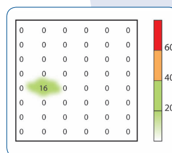
Colchón SIN descarga del talón. Colchón ALOVA monobloc multizona CON descarga del talón.