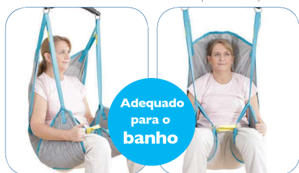
Universal Comfort Mesh