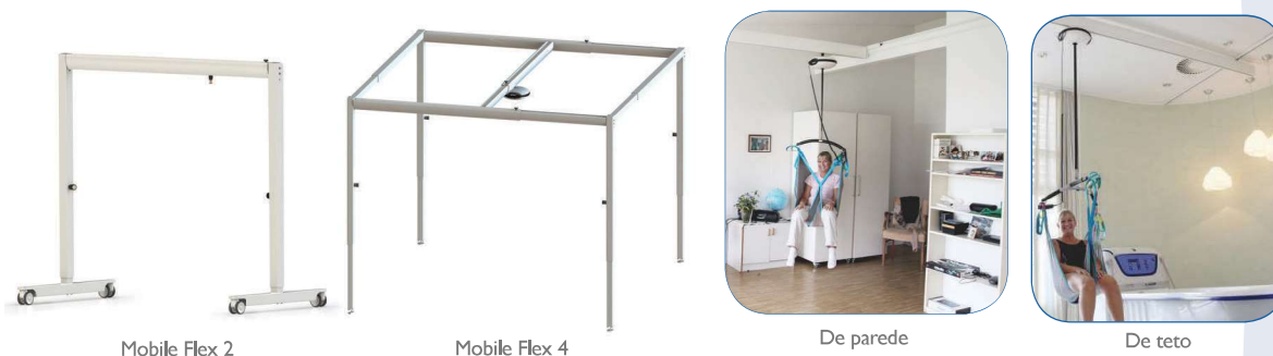
Mobile Flex 2