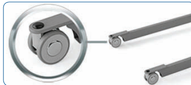
Opción: Ruedas de diseño